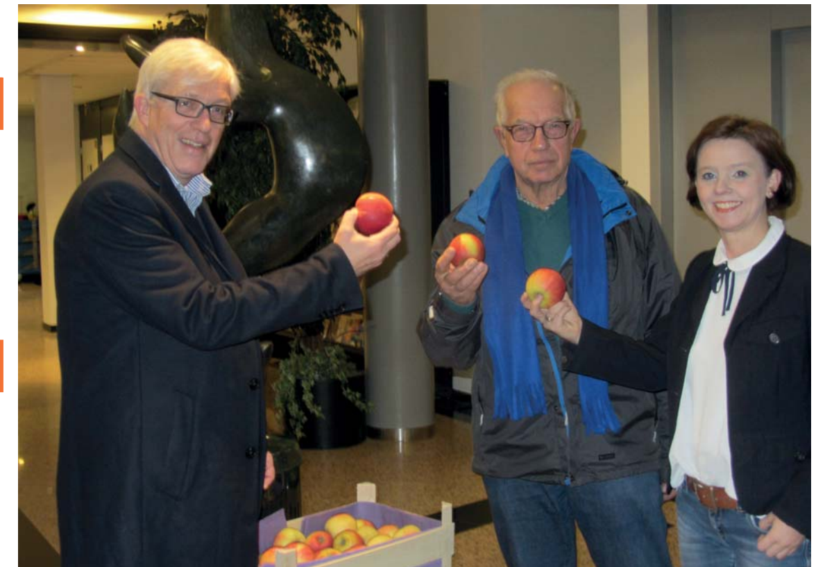
Foto van de (jaarlijkse) overhandiging van de appels van de vereniging Dorpsbelangen voor de gemeente medewerkers, als dank voor de plezierige samenwerking.