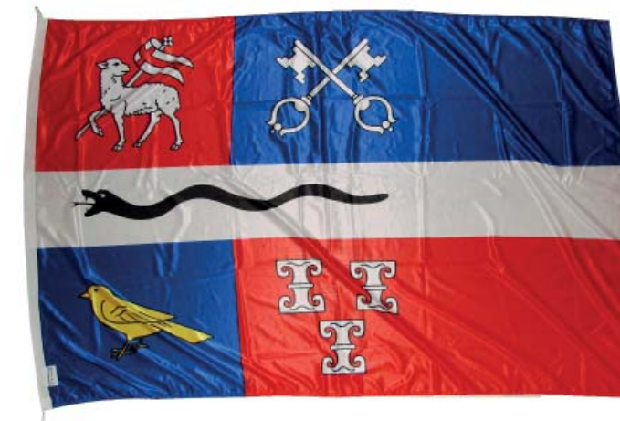
De nieuwe gemeentelijke vlag kan in top bij Baambrugse evenementen.

Daarnaast kreeg IJclub Baambrugge een gemeentevlag. De nieuwe gemeentevlag zal gaan wapperen bij alle ijsclub evenementen. Ook bij andere Baambrugse evenementen kan deze vlag in top. Gewoon even contact zoeken. Op de website staat hierover meer informatie met zelfs de mogelijkheid de vlag digitaal aan te vragen. Zeker doen; Baambrugge is De Ronde Venen!