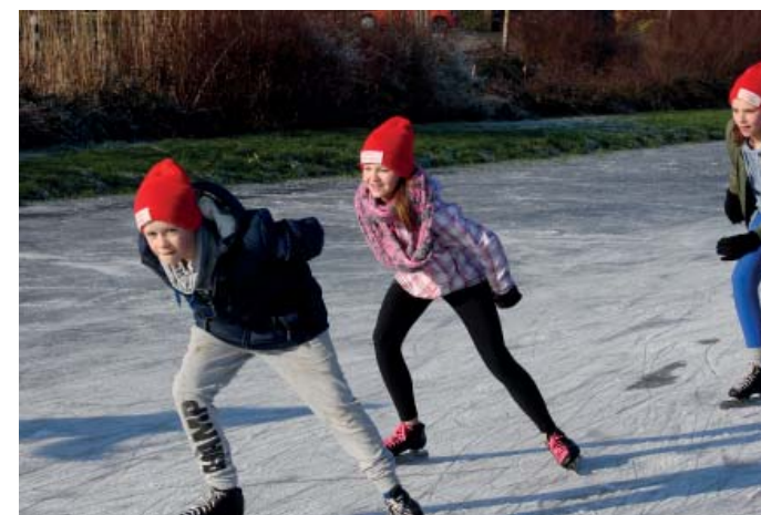
Schaatsplezier op het natuurijs van de landijsbaan.

Op de vierde zondag van Januari kon er eindelijk weer eens echt geschaatst worden op de landijsbaan in Baambrugge. Dat was een dag puur schaatsplezier. Als IJclub Baambrugge waren we wel weer eens toe aan echt schaatsen op natuurijs. Immers 23 januari 2013 was de laatste natuurijsdag geweest dat er op de landijsbaan geschaatst kon worden. Koning Winter leeft dus nog evenals de ijsclub.